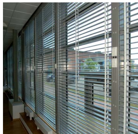
Fri ljusreglering • Manövreras med vev el. motor